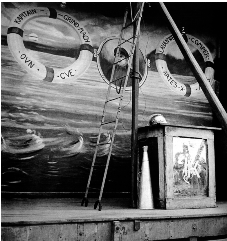
Jindřich Štýrský: Z cyklu Muž s klapkami na očích, 1934

a to s ohledem na rozdílnou moc při výběru toho, na co a s jakou intenzitou se budou dívat, s ohledem na způsob, jak se budou dívat, a také s ohledem na volbu konkrétního pořadu. Nicméně nepředpokládám, že jsou tyto empirické odlišnosti vyjádřením jejich esenciálních biologických mužských nebo ženských vlastností. Přikláním se spíše k tvrzení, že tyto rozdíly jsou důsledkem konkrétních sociálních rolí, které doma zaujímají jako muži a ženy. Navíc nepředpokládám, že by se konkrétní model genderových vztahů, který jsem našel v rámci domácnosti (se všemi důsledky, které má pro chování při sledování televize), musel nutně opakovat buď v nukleárních rodinách z různého třídního nebo etnického prostředí, nebo v různých typech domácností se stejným třídním nebo etnickým původem. Vždy jde spíše o to, zda a jak genderové vztahy působí a jsou utvářeny v rámci těchto různých kontextů.